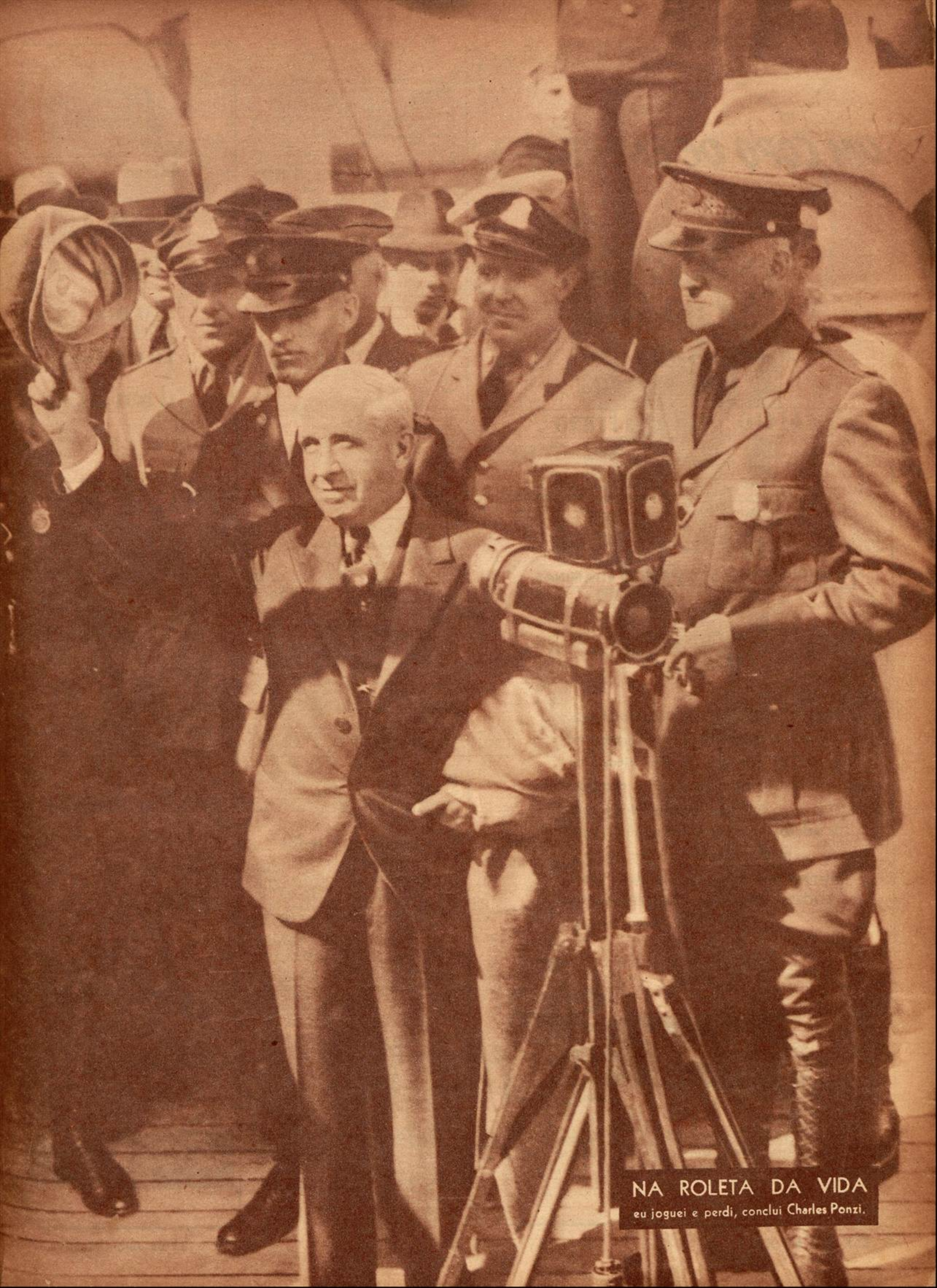
NA ROLETA DA VIDA eu joguei e perdi, conclui Charles Ponzi.