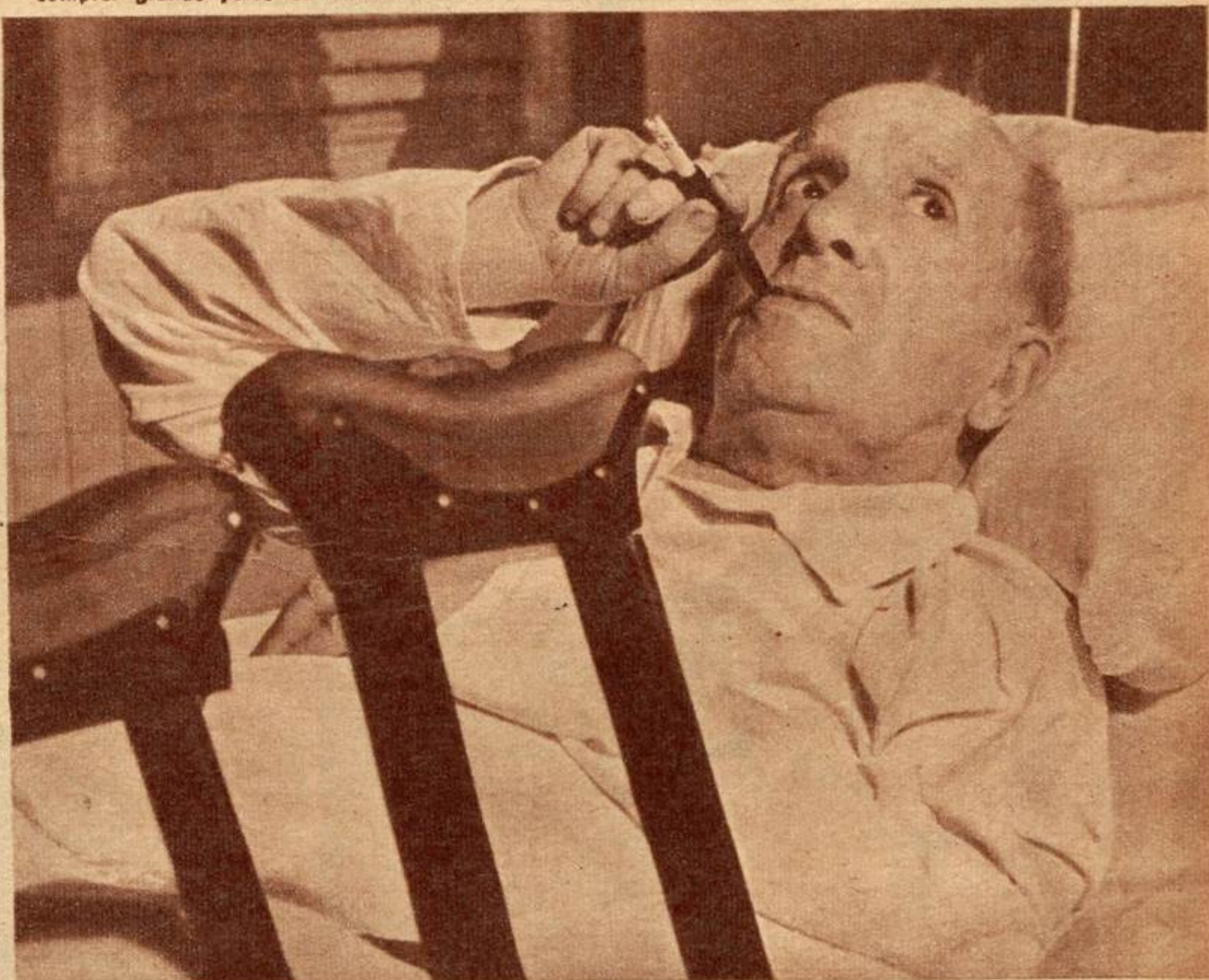
HOJE, pobre e simpático Mr. Ponzi, já não tem dinheiro para comprar um maço de cigarros. Velho e acabado, passa os dias contando sua história aos companheiros do hospital. Eles fingem que acreditam.