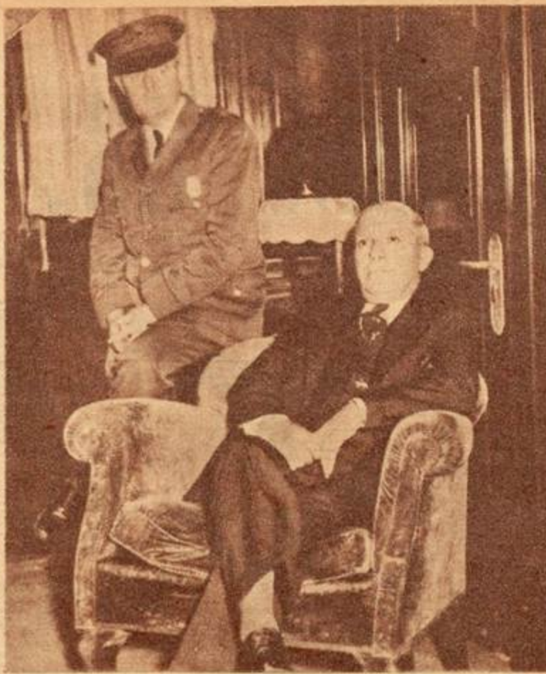
Já a bordo da primeira classe do "Vulcania", ele aguarda calmamente a hora de deixar os Estados Unidos, em cumprimento da ordem de deportação.