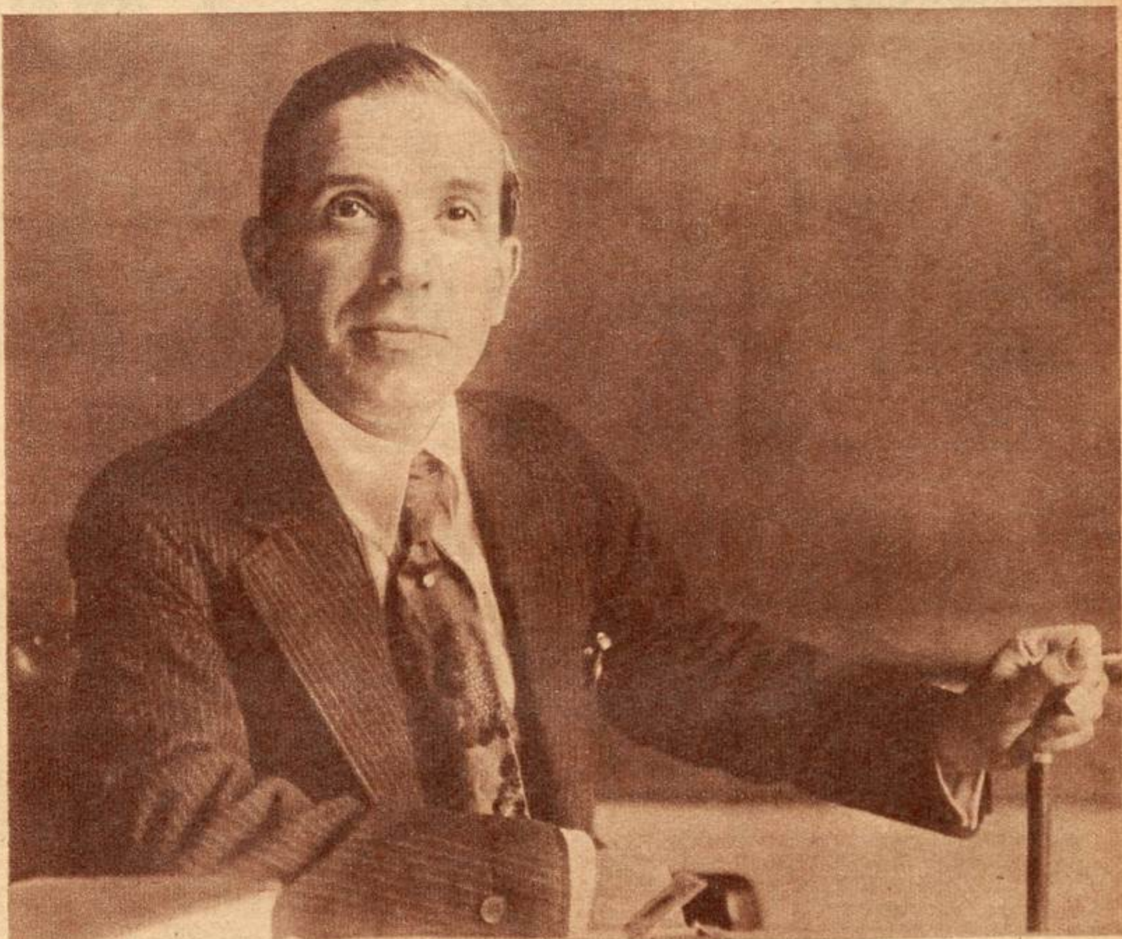
CHARLES PONZI da época áurea, quando tudo lhe sorria e navegava sobre trilhos de ouro, tentou comprar grande parte da marinha mercante dos Estados Unidos e a estrada de ferro de New York.

Fomos encontrar Charles Ponzi prostrado na cama, envelhecido, mas sempre irônico. Um homem simpático — e insistindo em considerar a vida o melhor de todos os bens e o único imprescindível. A sua ruína física não é recente: há muitos anos, os médicos lhe deram 30 dias de vida e a recomendação especial de não fumar. Após 32 dias, convencido de que os doutores haviam falhado em pelo menos dois dias — Ponzi voltou a fumar os 100 cigarros diários e a beber seu vinho quente no almoço. A vida para ele é uma questão de aritmética. A doença, contudo, o atacou pela segunda vez e com mais violência. Estava sozinho, num pequeno apartamento do Engenho Novo, quando sentiu a escuridão ao redor. Caiu e todo seu lado es-