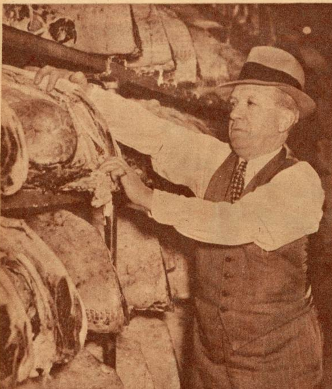
MUITOS EMPREGOS Mr. Ponzi exerceu nesta vida. Foi banqueiro, "business-man", escritor, professor, dirigente de companhias de aviação e açougueiro.